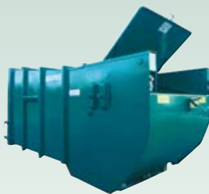
BPSK/BPS Komprimator for restavfall