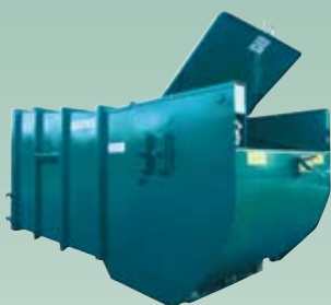
BPSK/BPS Komprimator for restavfall