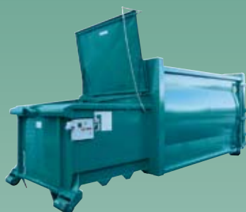
SP 1102 D Komprimator for papp og papir