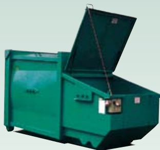
BPA Komprimator for papp og papir