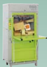
DIXI 10 S 8,5 tonn presskraft Ballevekt 50-80 kg