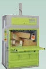
DIXI 25 S, 30 S 25 – 30 tonn presskraft Ballevekt 250 – 360 kg