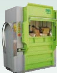
DIXI 60 S, 80 S 60 – 80 tonn presskraft Ballevekt 340 – 700 kg