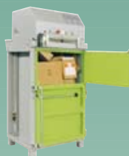
DIXI 5 S-K 6 tonn presskraft Ballevekt 40-60 kg