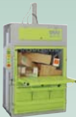
DIXI 25 S, 30 S 25 – 30 tonn presskraft Ballevekt 250 – 360 kg