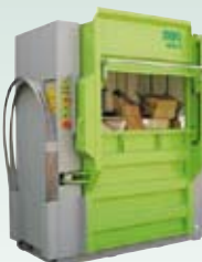
DIXI 60 S, 80 S 60 – 80 tonn presskraft Ballevekt 340 – 700 kg