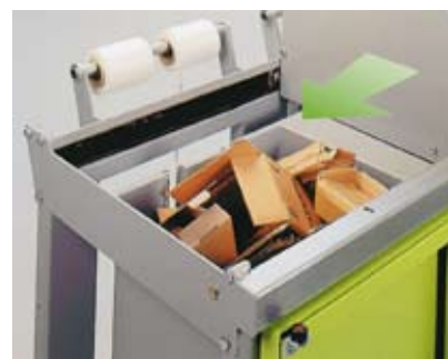
Ekstra presskammer (ekstraustyr).