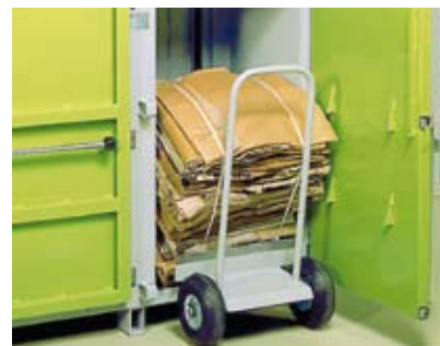
Balletralle letter arbeidet (ekstraustyr).