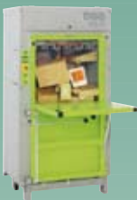
DIXI 10 S 8,5 tonn presskraft Ballevekt 50-80 kg