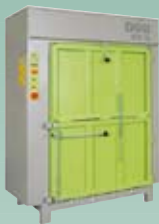
DIXI 18 S 18 tonn presskraft Ballevekt 140 – 220 kg