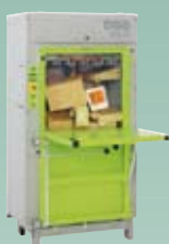
DIXI 10 S 8,5 tonn presskraft Ballevekt 50-80 kg