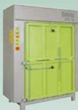
DIXI 18 S 18 tonn presskraft Ballevekt 140-220 kg