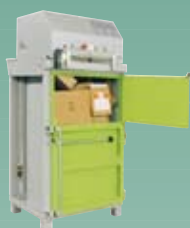
DIXI 5 S-K 6 tonn presskraft Ballevekt 40-60 kg